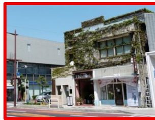
松山市千舟町3丁目4番地2