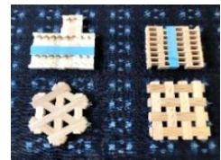
木組みコースター 四角/六角